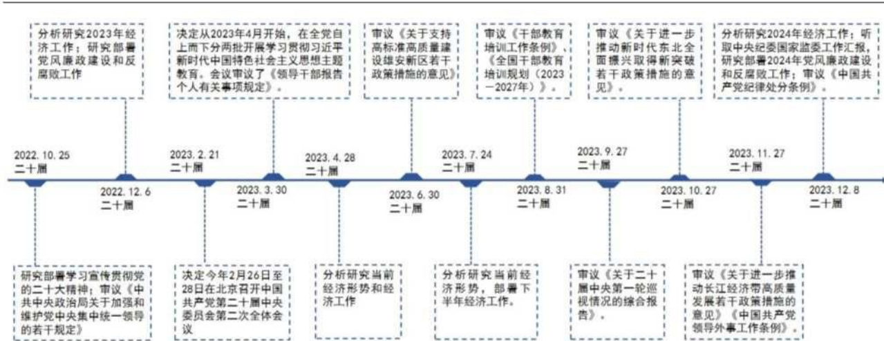
图1：第二十届中央政治局会议主题

除了 4 月和 7 月研究部署经济工作之外，2023 年以来，中央政治局还研究部署了主题教育、雄安新区建设、干部教育培训、东北振兴、长江经济带高质量等工作，审议通过了《领导干部报告个人有关事项规定》《关于支持高标准高质量建设雄安新区若干政策措施的意见》《干部教育培训工作条例》《全国干部教育培训规划（2023—2027 年）》《关于二十届中央第一轮巡视情况的综合报告》《关于进一步推动新时代东北全面振兴取得新突破若干政策措施的意见》《关于进一步推动长江经济带高质量发展若干政策措施的意见》《中国共产党领导外事工作条例》等文件。