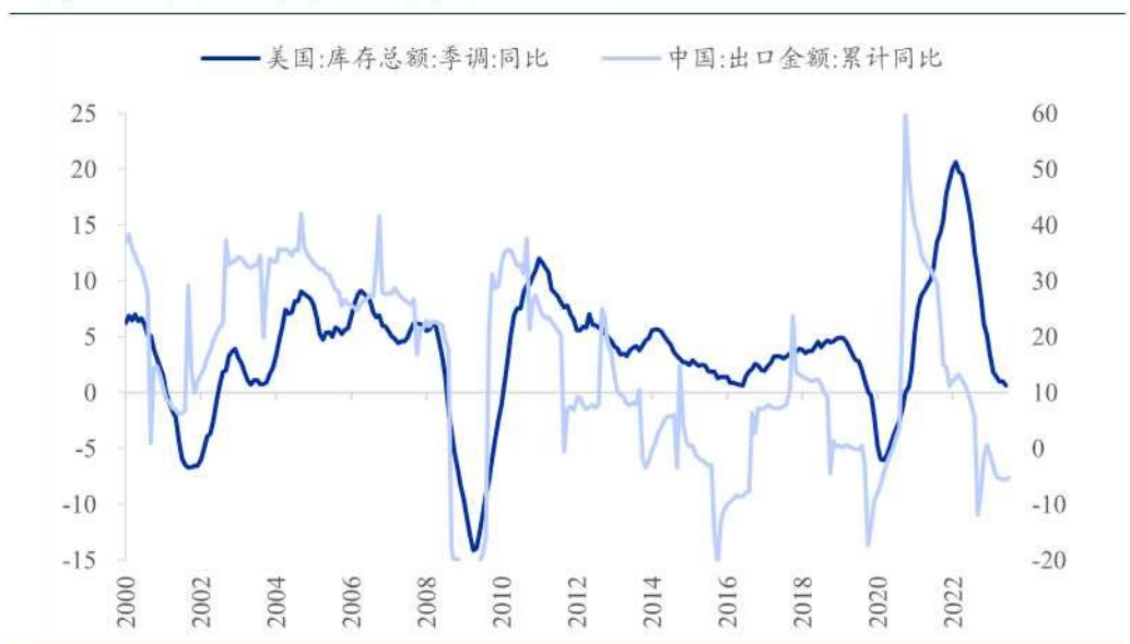
图表 6: 美国名义库存增速与中国出口金额增速

来源: Wind、华福证券研究所; 历史分位值的计算区间为 2000.01-2023.10