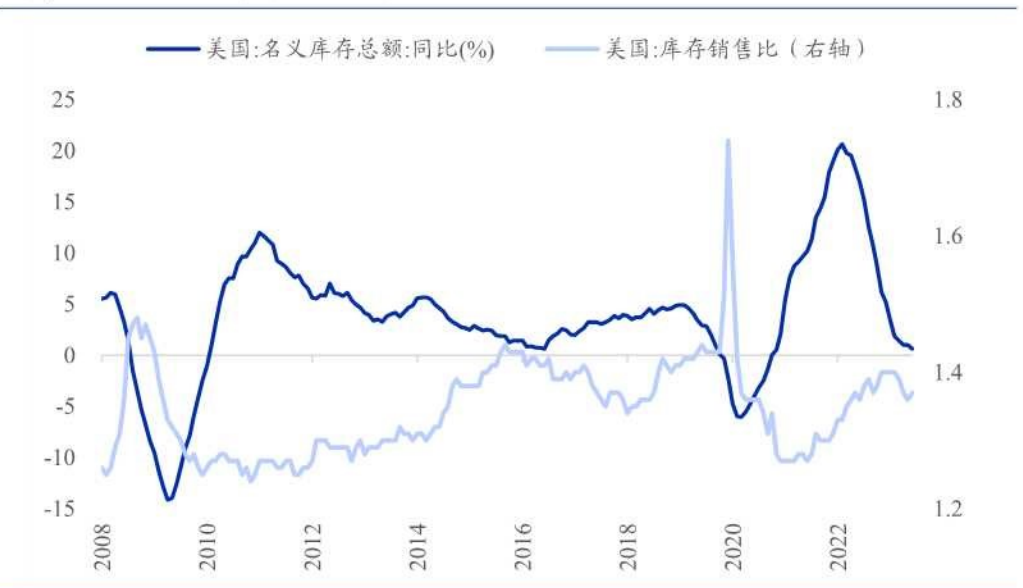
图表 1：美国名义库存增速和库销比