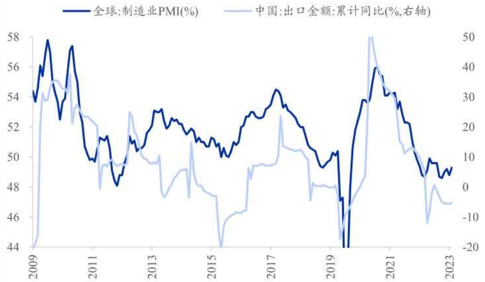
图表 7: 全球制造业 PMI 与中国出口金额增速