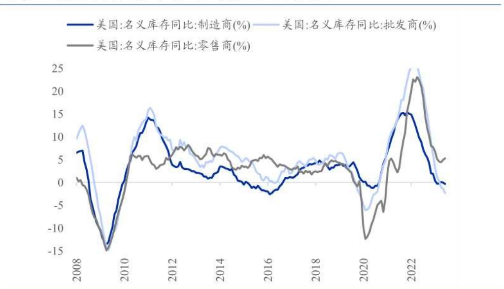
图表 2：按制造、批发、零售区分的美国名义库存增速