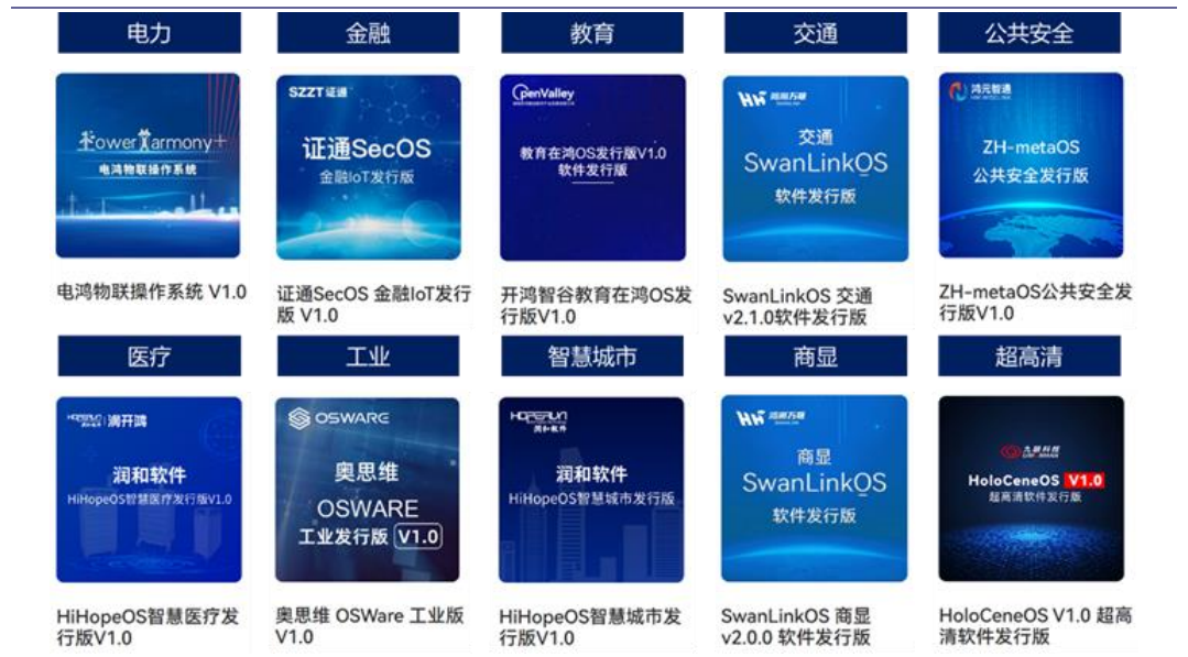
图表2: Openharmony 部分行业发行版