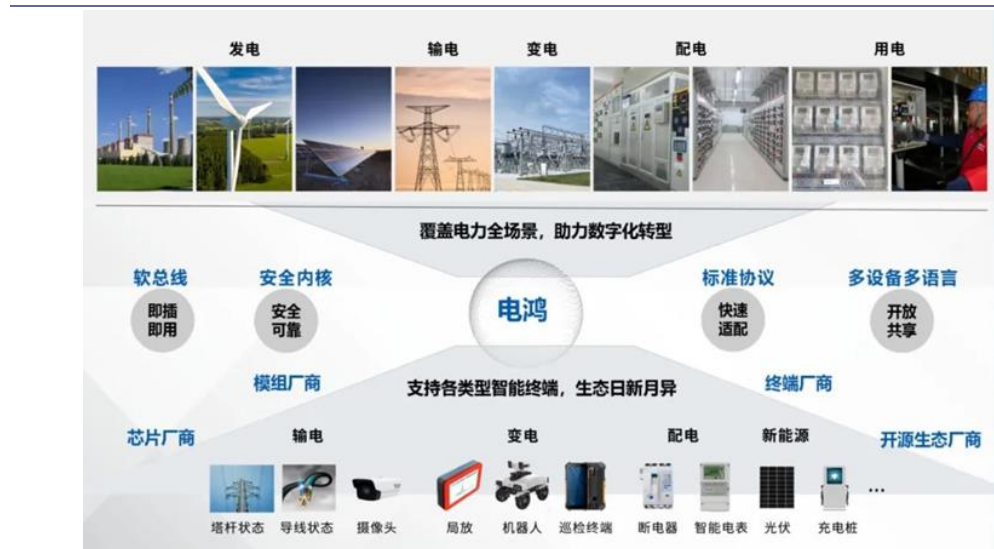
图表3: 电鸿物联操作系统覆盖电力全场景