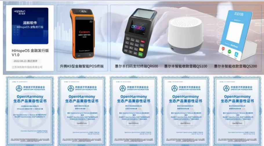
图表4：多款搭载 HiHopeOS 的金融数字化服务终端商用设备

以及分布式应用场景，包括常见的 POS 机、收银机、云播报音响，以及桌面智能终端、人脸支付终端、便携社保卡制卡机、电子签名柜外清、适老化数字设备智能零钱宝等。