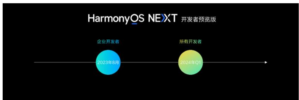
图表1：HarmonyOS NEXT 开放时间规划