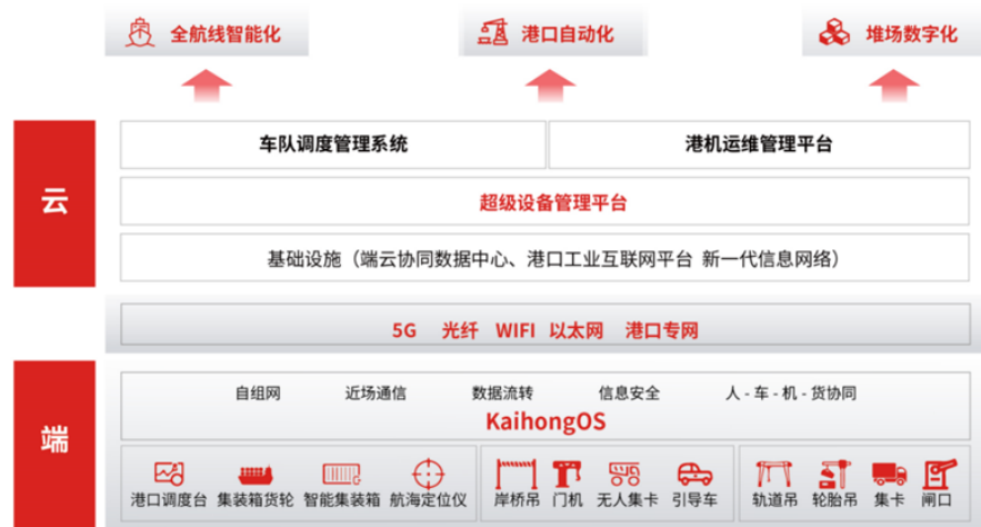
图表5：深开鸿智慧港口解决方案