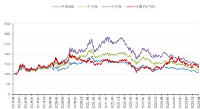
图2：计算机板块指数历史走势