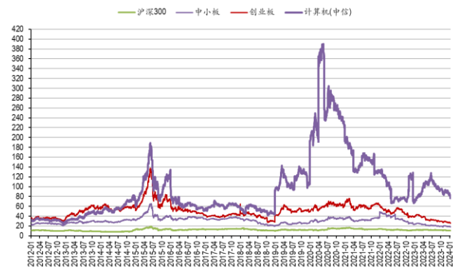
图3：计算机板块历史市盈率