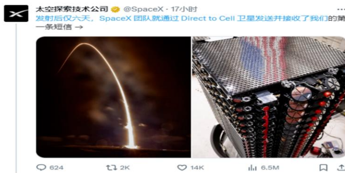
图表 1: 星链测试发送短信成功