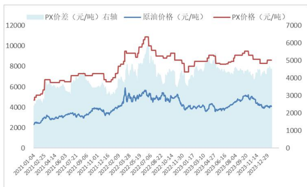
图3: PX 价格、价差 (元/吨)