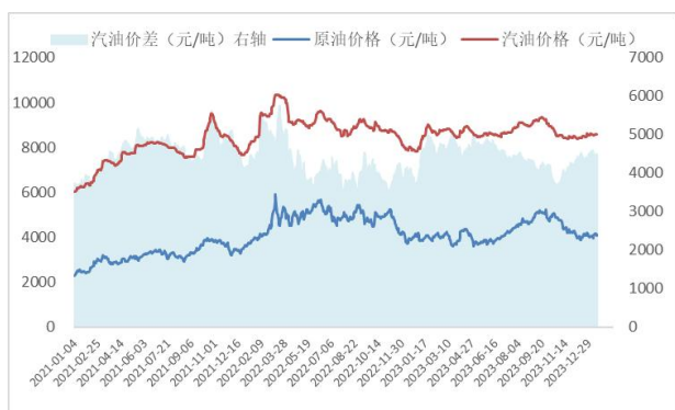
图1: 汽油价格、价差 (元/吨)