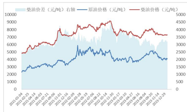
图2: 柴油价格、价差 (元/吨)