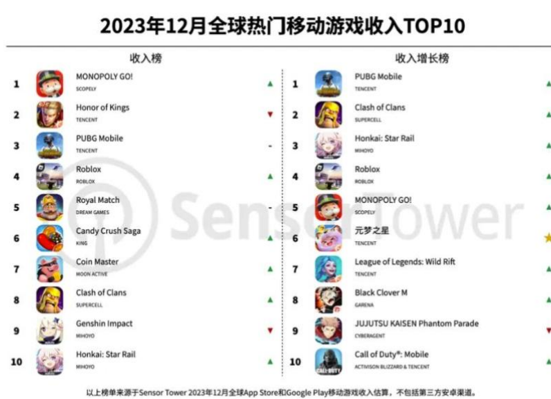
图3: 2023 年 12 月全球热门移动手游收入 TOP10

2023 年 12 月全球热门移动手游收入前三名分别为 Scopely《Monopoly GO!》和腾讯《王者荣耀》及《PUBG Mobile》。其中,腾讯《王者荣耀》以 2.03 亿美元的收入位列榜单第 2 名,并连续 15 天登顶中国 iPhone 手游畅销榜;腾讯《PUBG Mobile》(合并《和平精英》收入)以 1.83 亿美元的收入位列榜单第 3 名,其中 58.8%的收入来自中国 iOS 市场,美国市场的收入占 7.7%,印度市场占 6.8%。