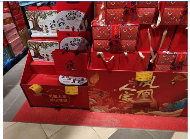
图 8：河北唐山商超调研零食