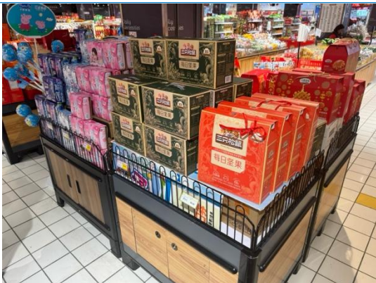
图 13：湖州商超三只松鼠坚果

3) 速冻： 速冻食品中，速冻火锅料中安井铺货较大，其次为桂冠、唯新和澳门豆捞，其中澳门豆捞定价高，为浙江杭州当地品牌；速冻馒头、包子、水饺主要以三全、安井、湾仔码头、龙凤、五丰为主；速冻汤圆以湾仔码头、龙凤为主。