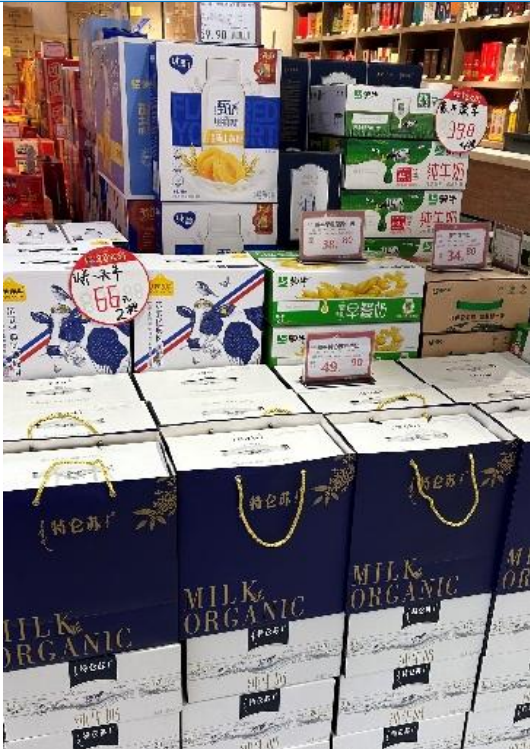
图 20：河南商丘睢县商超乳制品货架

乳制品是过年送礼几乎必备的产品，商丘睢县市场中，蒙牛、伊利、君乐宝等品牌竞争激烈。非乳饮料中，AD钙奶和旺仔牛奶也多为送礼选择。此外，强爽近年来较受年轻人欢迎，堆头醒目。