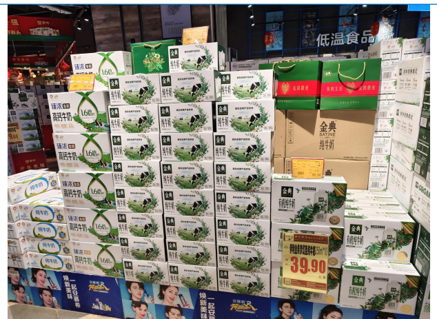
图 6：河北唐山商超调研乳制品