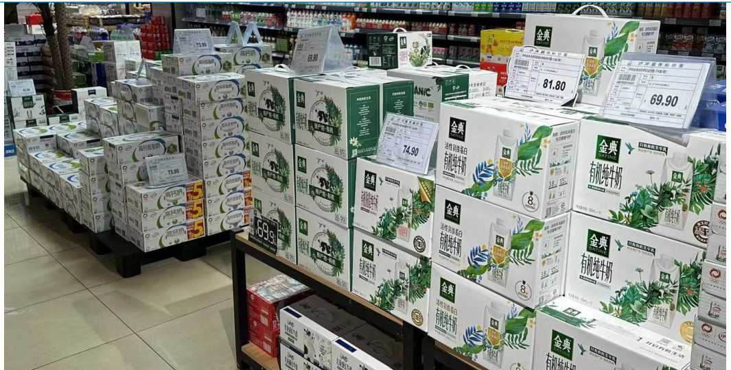
图 17：四川成都乳制品堆头