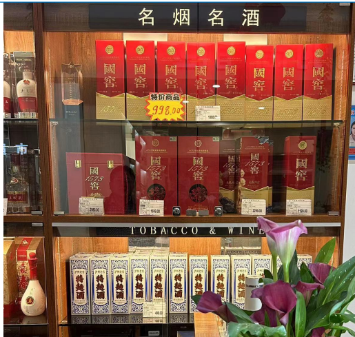
图 15: 四川成都商超调研白酒

口粮酒以本地酒为主，洋河认可度略低。1) 郎酒：零售价歪嘴 18.8 元（100ml 口粮酒）、红十 399 元，红十五 599 元。2) 丰谷：丰谷特曲 118 元，丰谷酒王 398 元。3) 洋河：海天梦在四川销售表现不好，消费者对于川酒和贵酒的接受程度比较高，对于苏酒不认可，口感难以接受。零售价格，海之蓝 208 元、天之蓝 398 元、M3 600 元、M6+ 800 元。