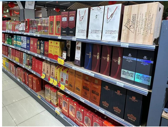
图 16: 四川成都商超调研白酒