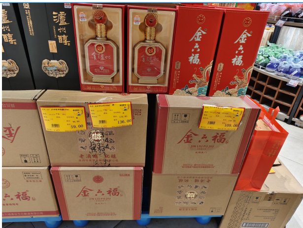
图 1：河北唐山商超调研白酒