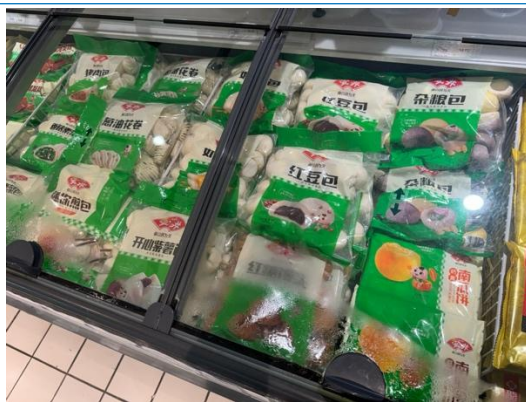
图 14：湖州商超安井货柜