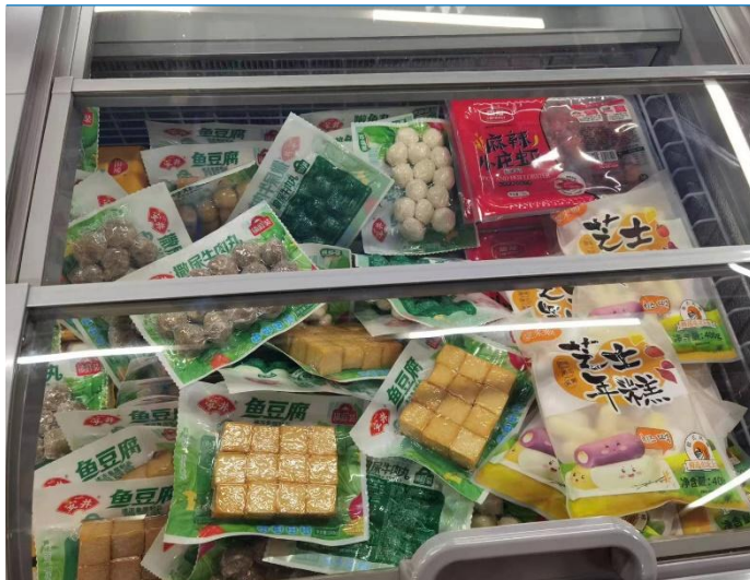
图 24：山东泰安新泰商超速冻食品