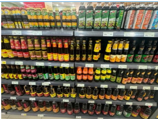
图 11：湖州商超调味品货架

4) 火锅底料： 湖州地区火锅底料消费主要为海底捞和好人家。各商超火锅底料品类较少，仅占据货架约四分之一，其中基本由海底捞和好人家产品组成，其余品牌包括呷哺呷哺、百味斋等，其中牛油辣味和番茄味产品最为畅销。