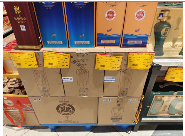
图 2：河北唐山商超调研白酒