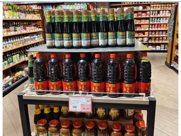
图 4：河北唐山商超调研调味品