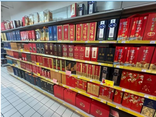
图 9：湖州商超白酒货架