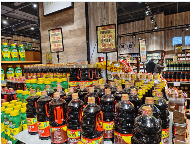
图 3：河北唐山商超调研调味品