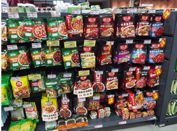
图 23：山东泰安新泰商超复合调味料包