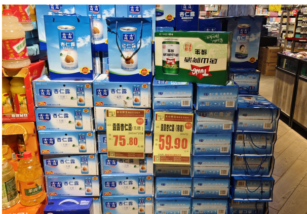
图 5：河北唐山商超调研乳制品