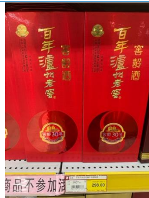
图 10：湖州春节期间畅销白酒