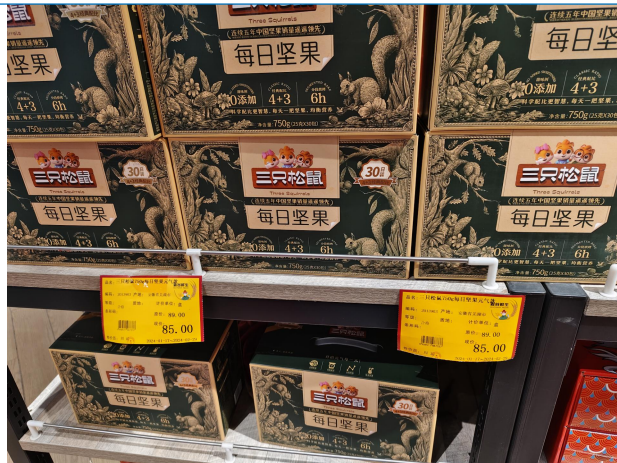
图 7：河北唐山商超调研零食