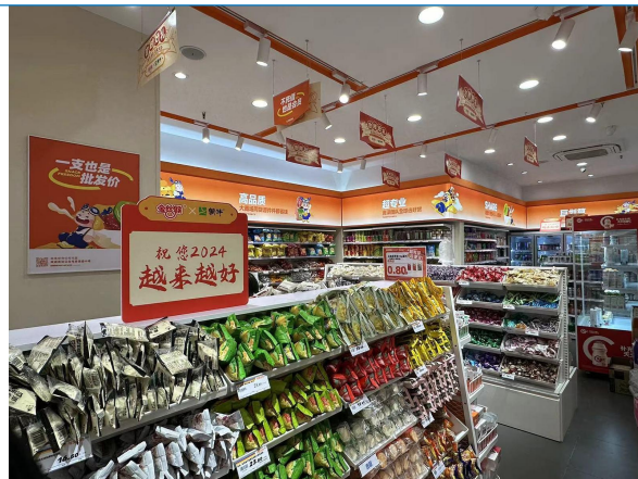
图 19: 四川成都零食量贩店调研 2