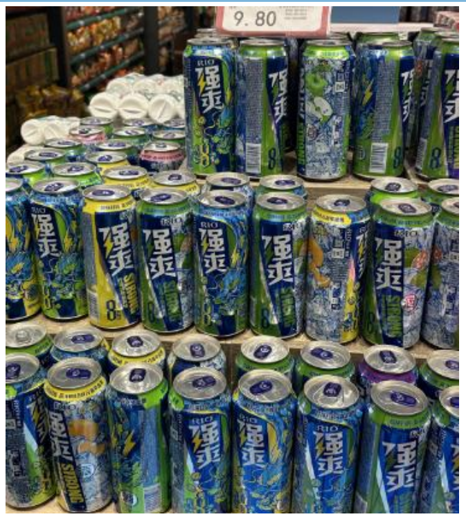
图 21：河南商丘睢县强爽堆头