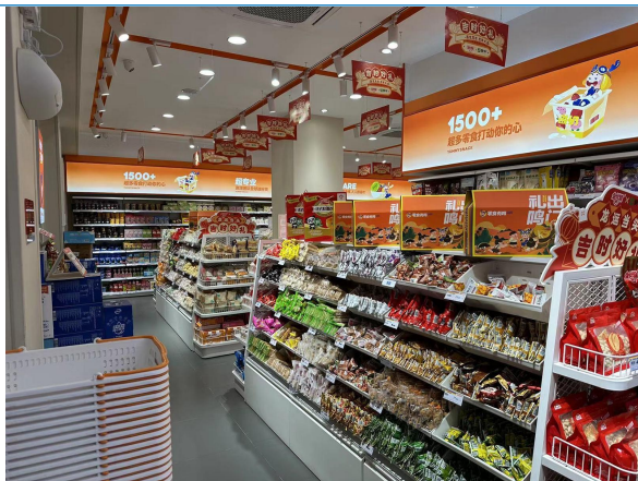
图 18: 四川成都零食量贩店调研 1