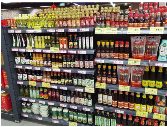
图 22：山东泰安新泰商超复合调味汁