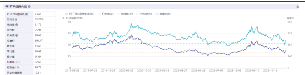
图：近 5 年行业 PE 情况

传媒行业当前 PE-TTM 为 23.66，近五年行业 PE（TTM）历史中位数为 25.94，行业 PE（TTM）当前百分位为 35.28%。