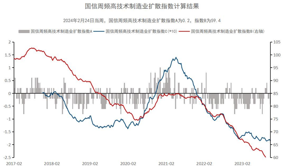
图1：国信高技术制造业扩散指数

截至 2024 年 2 月 24 日当周，国信周频高技术制造业扩散指数 A 录得 0.2，与上周持平；国信周频高技术制造业扩散指数 B 为 59.4，较上周上涨；扩散指数 C 为 -17.27，较上周上涨。从分项看，本周丙烯腈、6-氨基青霉烷酸、六氟磷酸锂价格、中关村电子产品价格指数保持不变，航空航天行业、新能源行业、医药行业、计算机行业景气度保持不变；动态随机存储器价格上涨，半导体行业景气度较上周上涨。