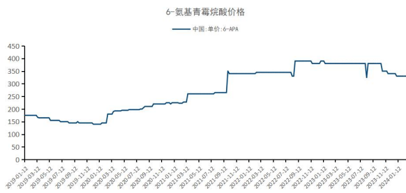
图2：6-氨基青霉烷酸价格持平

高技术制造业前沿动态上，据新华社 2 月 27 日消息，记者从自然资源部中国极地研究中心获悉，我国将在南极钻探一个冰下湖，正在开展的中国第 40 次南极考察中，内陆考察队员已成功进行实地探路。据中国极地研究中心极地冰雪与气候变化研究所研究员姜苏介绍，这个冰下湖位于东南极内陆冰盖伊丽莎白公主地区，深埋在冰盖下方超过 3600 米，距离中国南极泰山站 120 千米。2022 年，我国正式将这个形似“麒麟静卧”的冰下湖命名为“麒麟冰下湖”，现已被南极研究科学委员会（SCAR）收录。