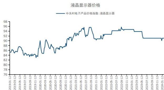
图7: 液晶显示器价格持平