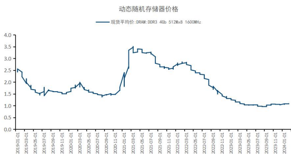
图4：动态随机存储器价格上涨