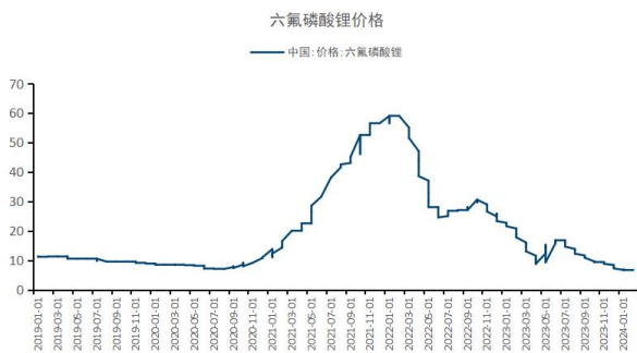
图6: 六氟磷酸锂价格持平