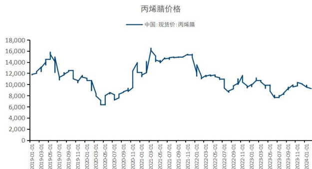
图3：丙烯腈价格持平