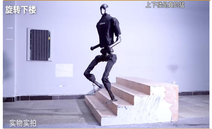
图 3：H1 出色的平衡能力使其可以在楼梯上旋转下楼