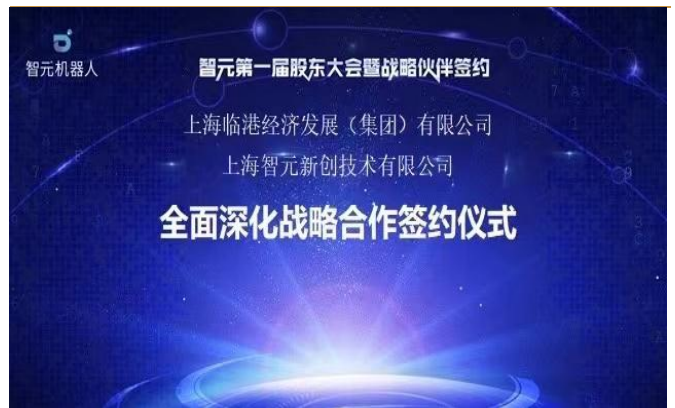
图 7：临港集团与智元机器人签署全面深化战略合作协议