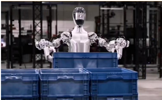
图 4：Figure 01 可以灵活搬起箱子

2月29日，Figure 在其 Twitter 官宣 6.75 亿美元融资，投后估值达 26 亿美元。其中贝佐斯通过 Explore Investments LLC 投资 1 亿美元、微软投资 9500 万美元、英伟达和一个亚马逊附属的基金各提供 5000 万美元、英特尔的风险投资部门投入 2500 万美元、LG Innotek 提供 850 万美元、三星的投资集团出资 500 万美元、一度考虑收购 Figure 的 OpenAI 投资 500 万美元。