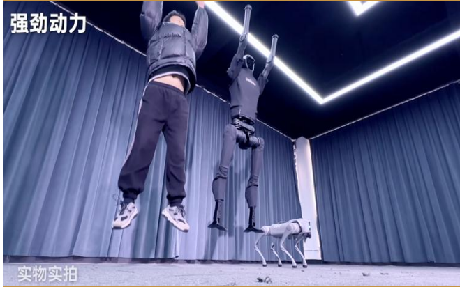
图 2：H1 可以实现和人类相似的原地起跳高度

值得关注的是，H1 尚未展示灵巧手精细操作能力（展示拿起物体时手指基本没有动），未来有望进一步展示灵巧手的工作能力。