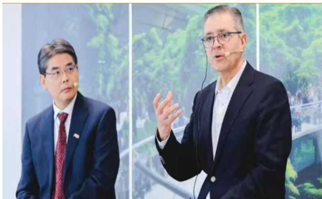
图 6：ABB 举办人工智能战略发布会

临港集团与智元机器人签署全面深化战略合作协议。 2月28日，临港集团与智元机器人举行全面深化战略合作协议签约仪式，自 23 年 8 月签署《战略合作协议》以来，双方合作不断深化，智元机器人研发中心、测试基地、生产制造基地先后落地临港集团园区。仪式组织了智元制造工厂落地签约、产品采购集中签约、合作伙伴战略签约等多个环节，推动智元机器人从临港奉贤的首期生产制造基地开始，开启商用量产的新征程，打造成为上海人形机器人第一座量产工厂。同时，集团旗下多家子公司与智元机器人达成了采购机器人产品的意向协议。集团产业投资促进中心和智元机器人分别就“人形机器人服务机场创新合作”“智慧工厂（5G+AI+机器人）”等事项与上海机场集团大数据中心、中国电信上海公司工业和服务业大客户部签署三方战略合作备忘录。