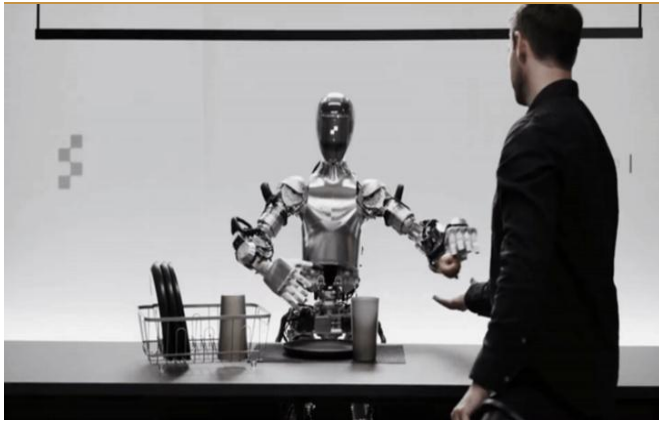
图 2: Figure 01 可以识别出苹果为食品并递到主人手中