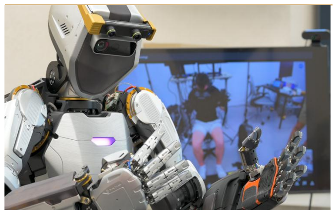
图 7: Phoenix 拥有可精细操作的灵巧手