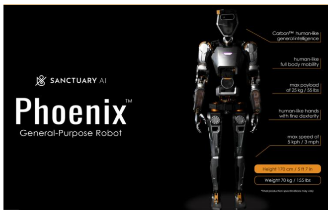
图 6: Phoenix 基本参数

加拿大研发出人形机器人 Phoenix ，能够自主工作。近日，温哥华一家人形机器人公司 Sanctuary AI 发布了一个能够自主工作的人形机器人—Phoenix。Phoenix 高 1.7 米，重 70KG，最大负载为 55 磅，最大速度为 4.8 公里/小时。它配备了行业领先的机械手，具有 20 个自由度，可与人类的手灵巧、精细的操纵媲美，具有仿真触觉技术。Phoenix 由开创性和独特的 AI 控制系统 Carbon 提供支持。Carbon AI 控制系统模仿人脑中的子系统，例如记忆、视觉、声音和触觉。Carbon 集成了现代人工智能技术，将自然语言转化为现实世界中的行动，具有可解释和可审计的推理、任务和运动计划，为 Phoenix 提供了像人一样思考然后行动完成工作任务的能力。