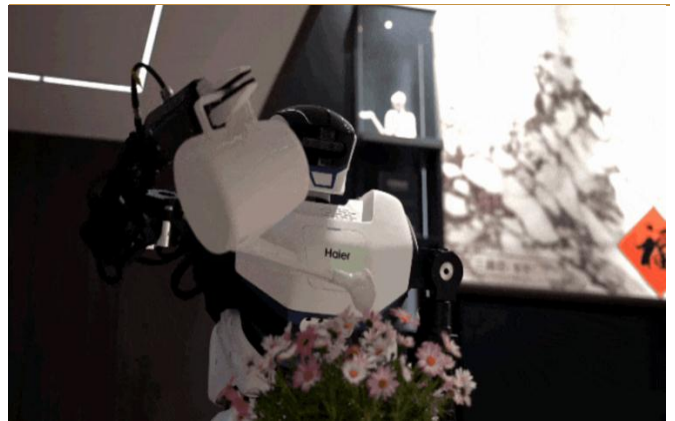
图 5: Kuavo 学习浇花