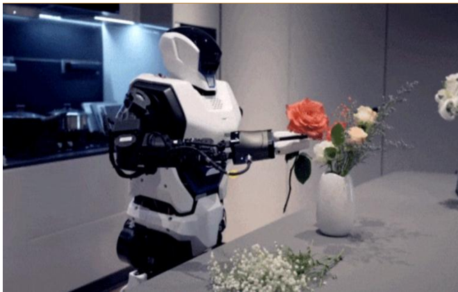
图 4: Kuavo 学习插花

目前研发团队仍在持续对机器人本体结构、运动控制算法、软件工程等方面进行整机迭代优化。较先前版本, 此次 Kuavo 的自由度不仅增加到了 28+, 全身运动控制的能力还得到了大幅提升, 乐聚研发团队表示, 下一步会将人形机器人的自由度提升到 40+。关节电机方面, 团队正在利用新型电机结构设计更高扭矩密度的新一代一体化关节, 其能承受拥有 10 倍冲击过载, 将使整体扭矩性能提升 30%, 且具备高转动刚度、高力矩带宽、高力矩精度的特性。