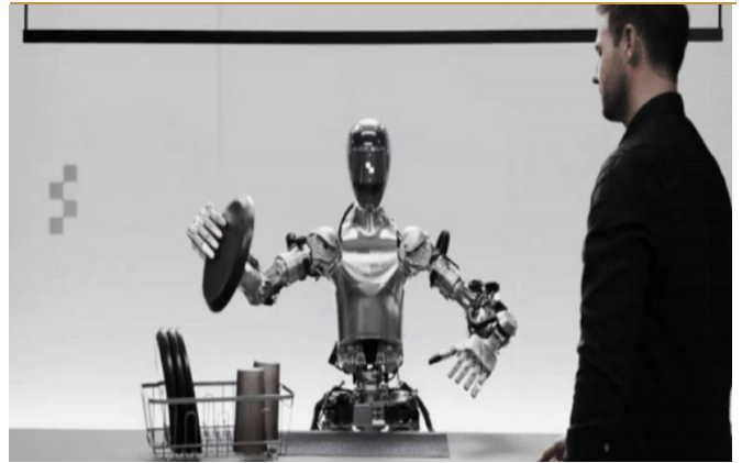
图 3: Figure 01 可以将碗碟归纳