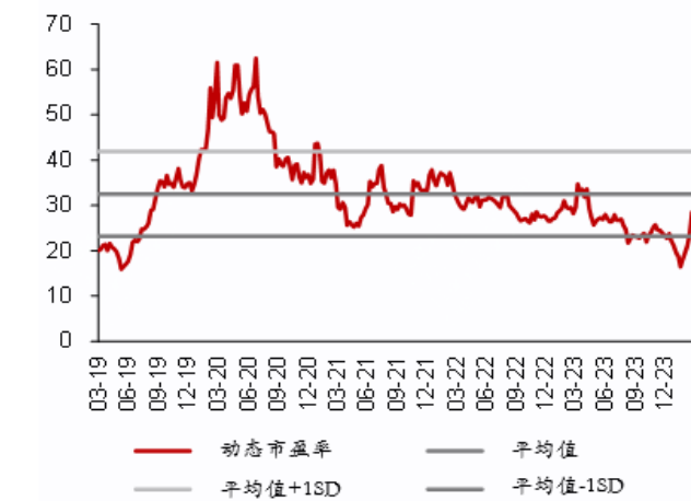
图 1:深南电路动态市盈率区间