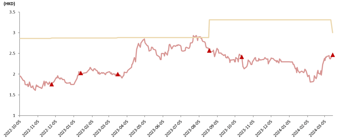
中国建筑兴业(830 HK): 股价表现及中泰国际给予的评级和目标价