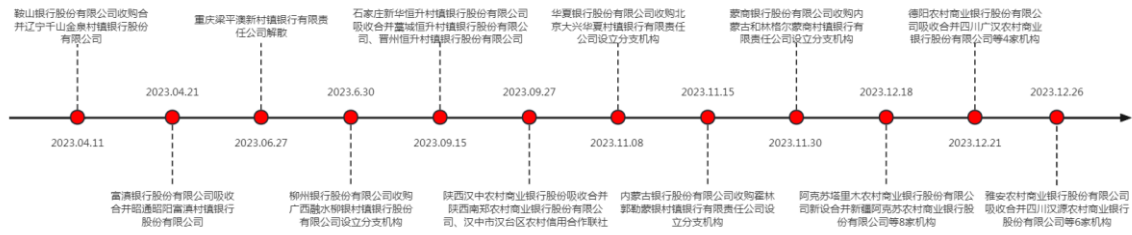
图2 2023年以来部分中小银行改革化险事件