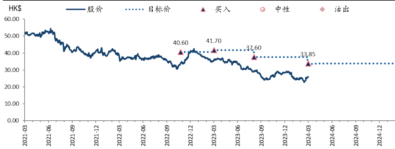
图表 3: 恒安国际 (1044 HK) 目标价及评级