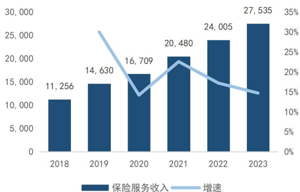
图1: 公司保险服务收入及增速 (单位: 百万元, %)