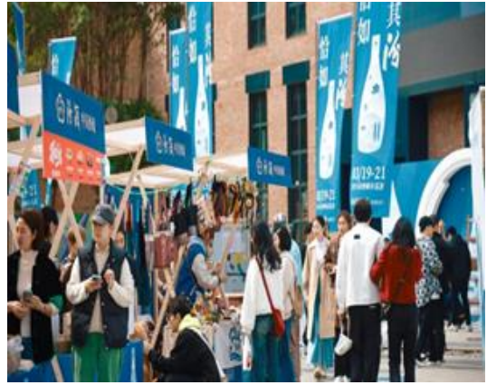
图表 2. 汾酒城市巡游活动现场