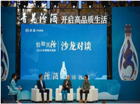
图表 1. “恰如其汾——2024 汾酒城市巡游计划” 沙龙