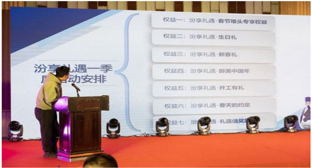
图表 3. “汾享礼遇，最美新春” 核心终端会议