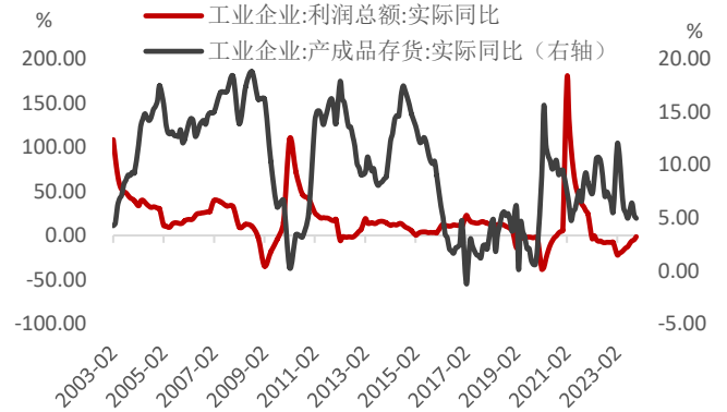
图 4: 当前仍处于被动去库存阶段