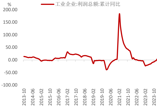
图 1: 工业企业利润累计同比及当月同比