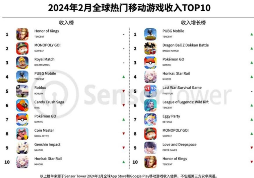
图3：2024年2月全球热门移动游戏收入TOP10