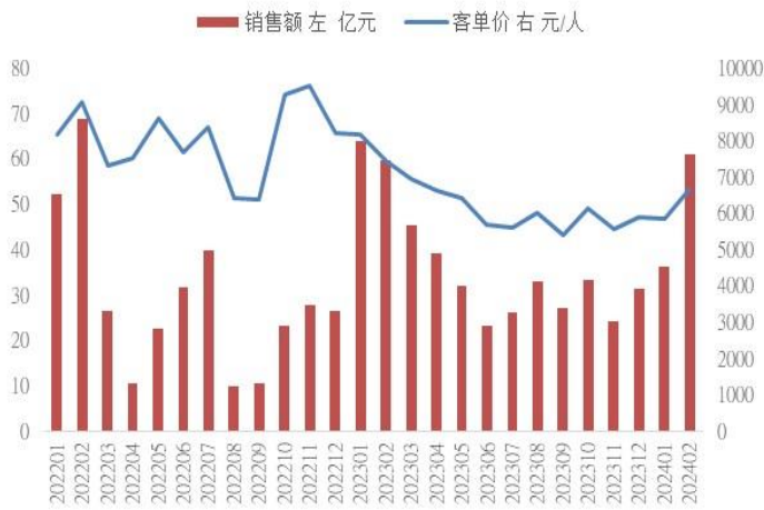
图：离岛免税销售情况