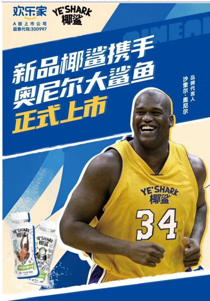
图3：欢乐家官宣篮球明星奥尼尔成为“椰鲨”品牌代言人