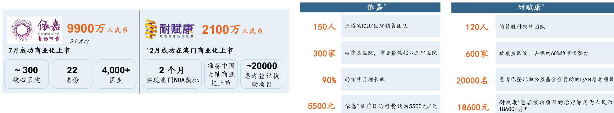
图：公司依嘉和耐赋康2023年销售额及商业化团队搭建情况