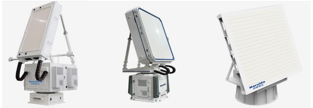
图3: 纳睿雷达部分相控阵雷达产品