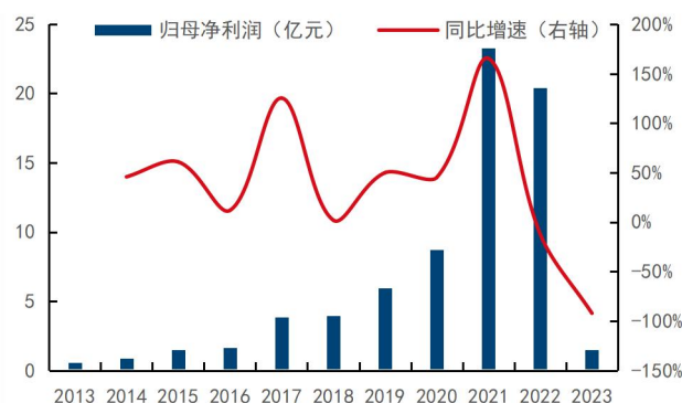
图3: 公司年归母净利润及同比增速