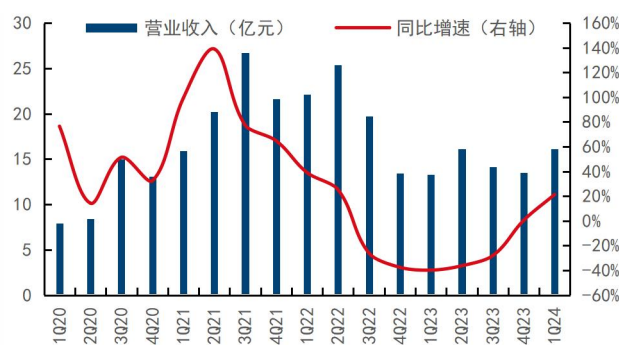
图2: 公司季度营业收入及同比增速