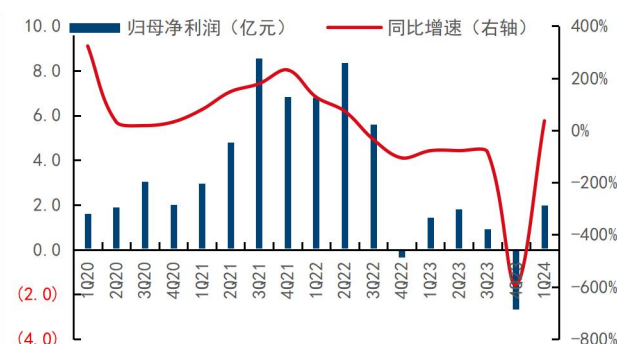
图4: 公司季度归母净利润及同比增速