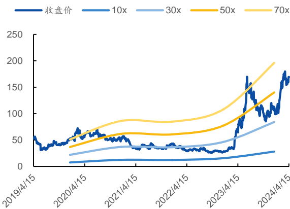
图 2: P/B Band