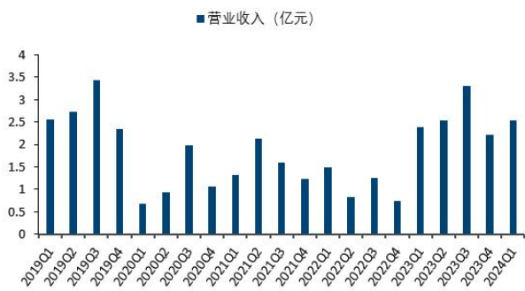
图1: 公司 2019-2023 年各季度营业收入表现