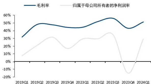
图3: 公司毛利率、净利率变化情况