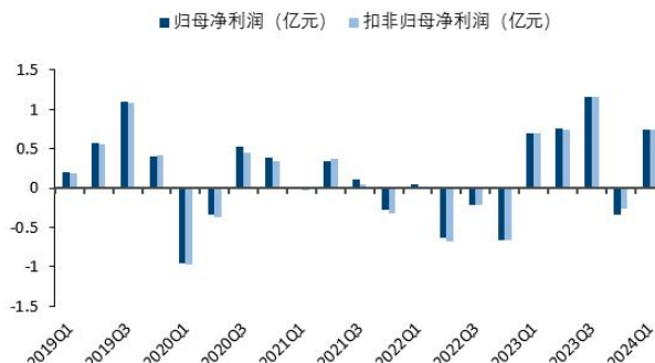
图2: 公司 2019-2023 年各季度利润表现