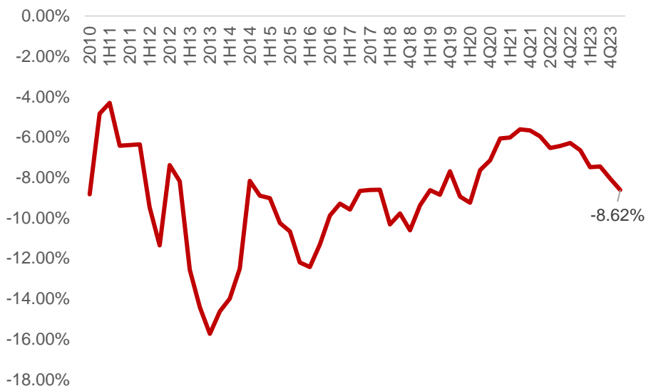
图表 4：自 1H10 银行股处于低配状态

值合计为 436.12 亿元，占一季度银行业流通市值上升规模的 5.3%，其他银行解禁规模不大。 3、银行板块低配差 2016 年来保持全行业最高 ，低配差排位第二的是建筑装饰板块，两者相差 1.55%。