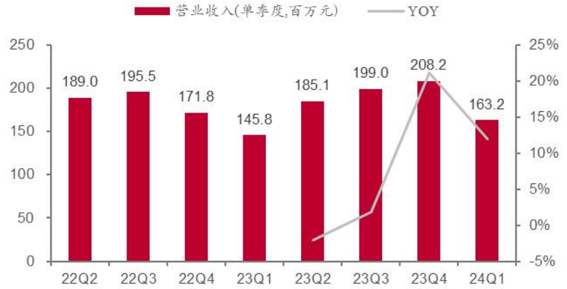
图表 2：公司分季度营收情况

预计 24 年 Q1 公司的主要业务制动系统类业务（轮毂轴承单元等）持续稳定增长。该业务对应的市场天花板较高，2021 年度全球汽车轮毂单元后市场的市场规模约 538.8 亿元，公司市占率不足 2%。目前公司已与下游客户建立充分联系，并着手进一步建立北美市场的本地服务能力，未来渗透率有望持续提升。