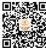
【公众号】 国金证券研究