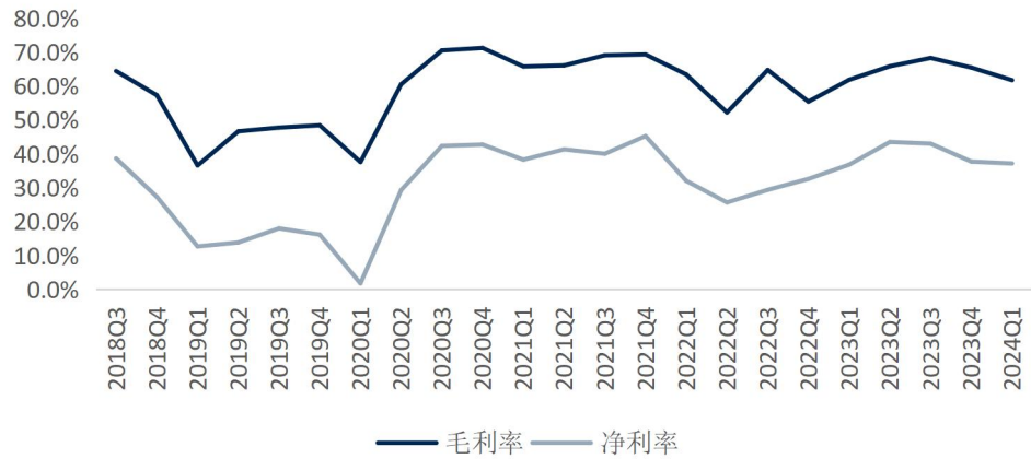
图5: 毛利率及净利率持续改善