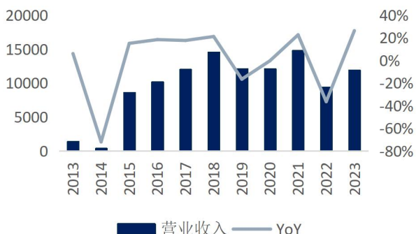
图1: 公司营业收入及增速 (单位: 百万元、%)

营收及净利润持续改善。 1) 公司披露 23 年及 24 年 Q1 财报: 1) 23 年全年实现营业收入 119.04 亿元、归母净利润 48.27 亿元, 对应摊薄 EPS 0.33 元, 同比增长 72.98%; 实现扣非归母净利润 43.74 亿元、同比增长 82.68%; 2) 23 年 Q4 公司实现营收 32.28 亿元、归母净利润 12.25 亿元, 同比分别增长 57.1%、85.8%, 对应摊薄 EPS 0.08 元; 3) 24 年 Q1 公司实现营业收入 27.3 亿元、归母净利润 10.4 亿, 同比分别增长 6.02%、10.5%, 对应摊薄 EPS 0.07 元; 4) 23 年度计划向全体股东每 10 股派发现金 3.30 元 (含税), 共计派发 47.66 亿元。