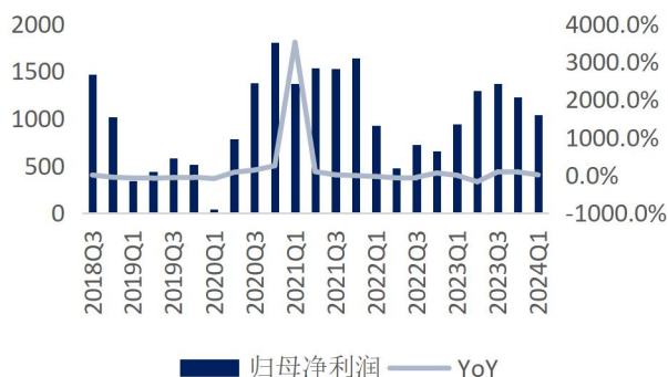
图4: 公司单季归母净利润及增速 (单位: 百万元、%)