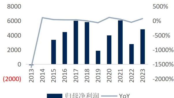
图2: 公司归母净利润及增速 (单位: 百万元、%)