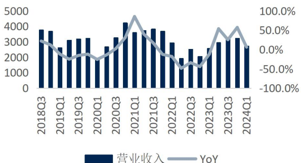
图3: 公司单季度收入及增速 (单位: 百万元、%)