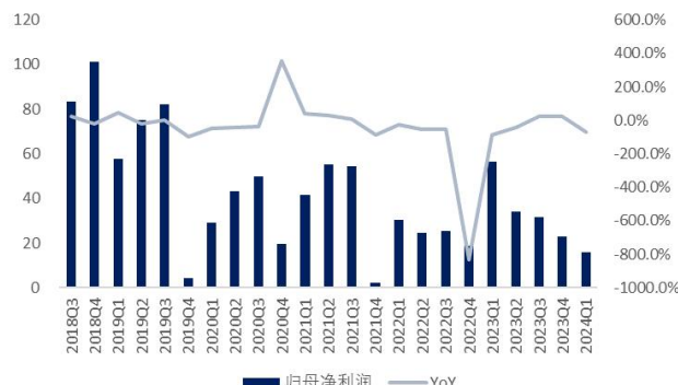
图4: 视觉中国单季归母净利润及增速 (单位: 百万元、%)