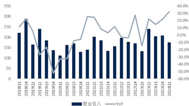
图2: 视觉中国单季营业收入及增速 (单位: 百万元、%)