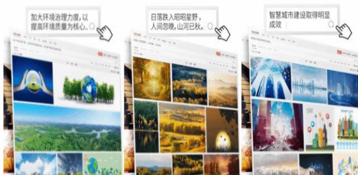
图5: AI 智能搜索

在客户下载使用 AI 创意工具创作的图片并确认付费后，原版权图片的创作人依然可以获得相应分成收益。AIGC 不仅赋能平台的内容使用者，而且还可以为上游创作者增加收益。2023 年 6 月，公司在 vcg.com、veer.com 网站为用户提供“AI 灵感绘图”的内容生成服务，以满足客户最新需求。