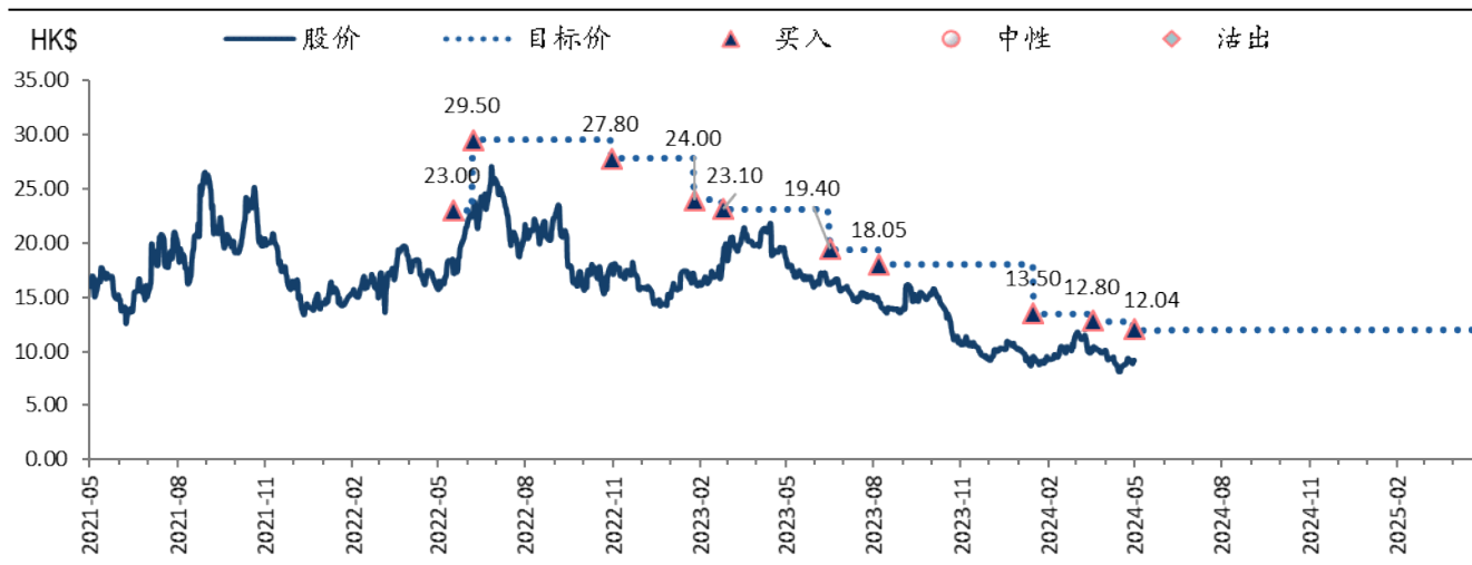
图表 1: 新特能源 (1799 HK) 目标价及评级