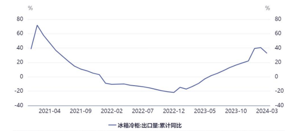
图 3：2021 年以来我国冰箱冷柜出口量累计同比增速变动情况