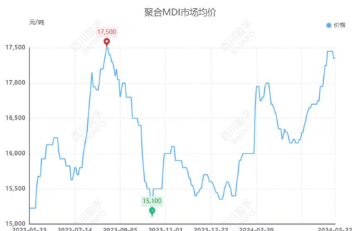
图 1：近一年来聚合 MDI 价格走势图