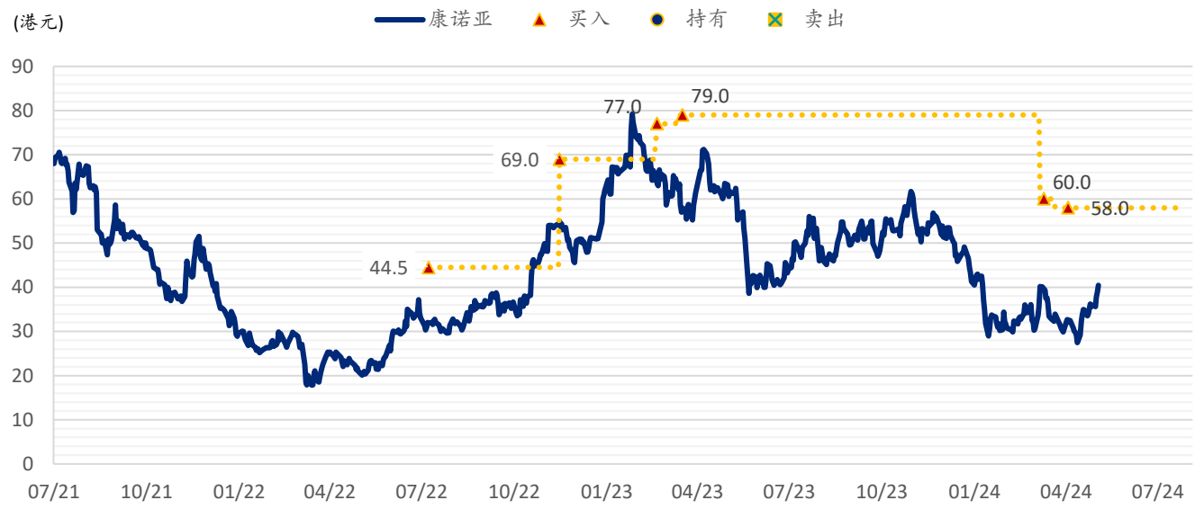
图表 3：浦银国际目标价：康诺亚