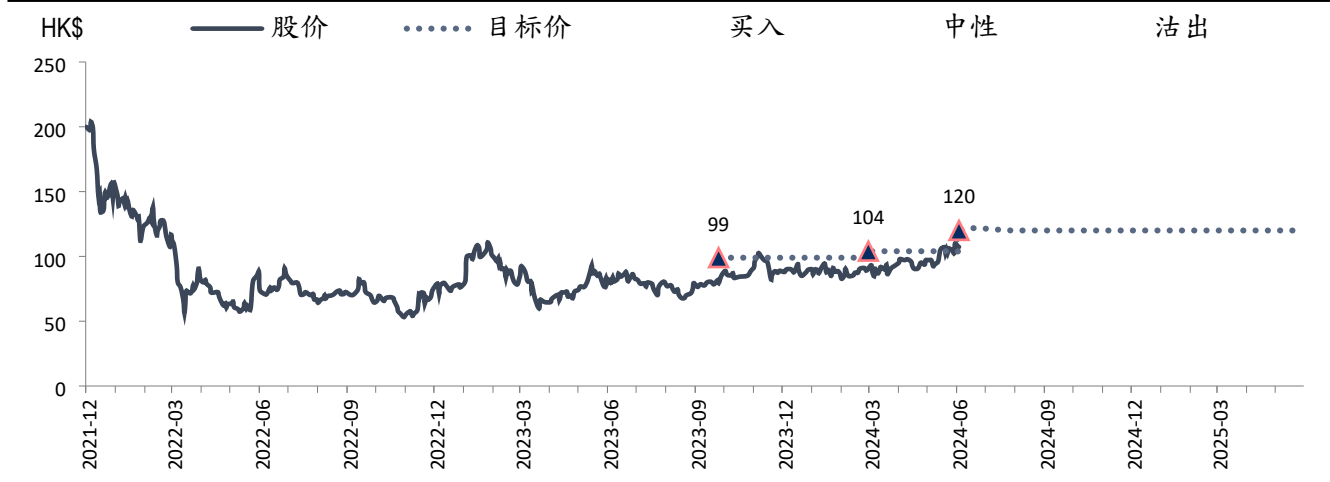
图表 2: 云音乐 (9899 HK) 目标价及评级