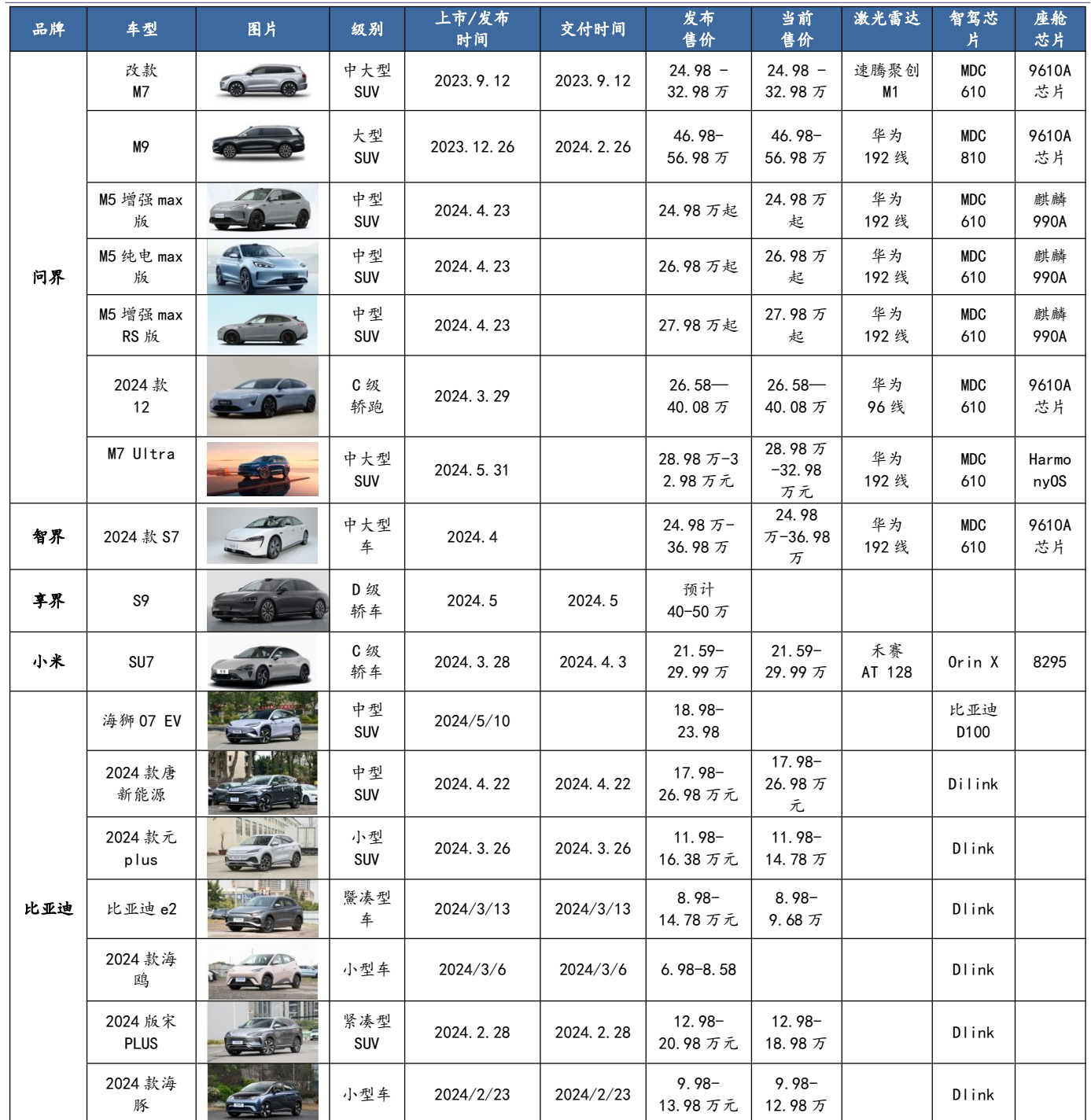
图表 1：明星品牌近 1 年新发布车型（含改款及上市新车，截至 20240602）