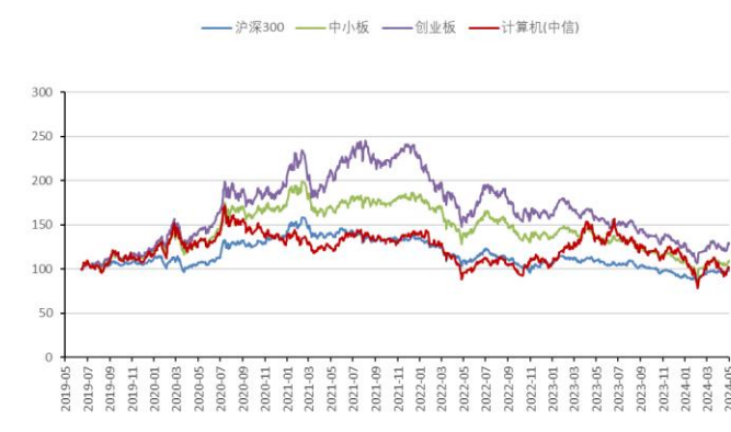
图2：计算机板块指数历史走势