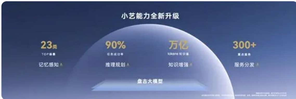
图表：小艺能力全新升级