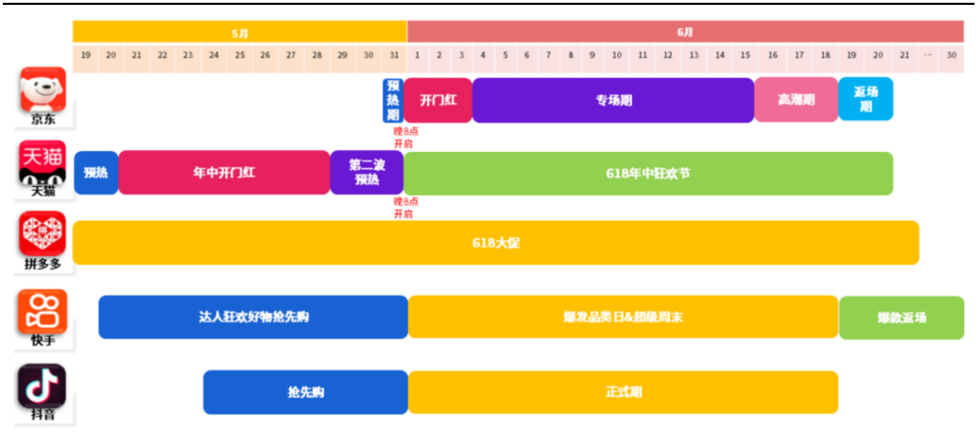
图1: 各平台 2024 年 618 活动时间节点一览

从活动的时间节点看，多数平台 2024 年 618 活动相较于 2023 年有所拉长，全面取消预售，折扣力度基本相当。虽然天猫/京东等平台均取消预售，但 618 开始时间（5.20）比去年的预售（天猫 5.26、京东 5.23）更早，抖音平台 618 开始时间与去年保持一致（5.24）。折扣力度看天猫京东的满减折扣力度（满 300-50）和去年基本相当。