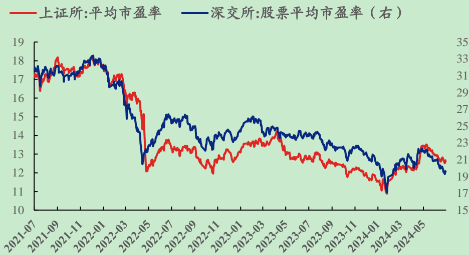
图 1: 最近三年沪深两市平均市盈率变化 (单位: 倍)