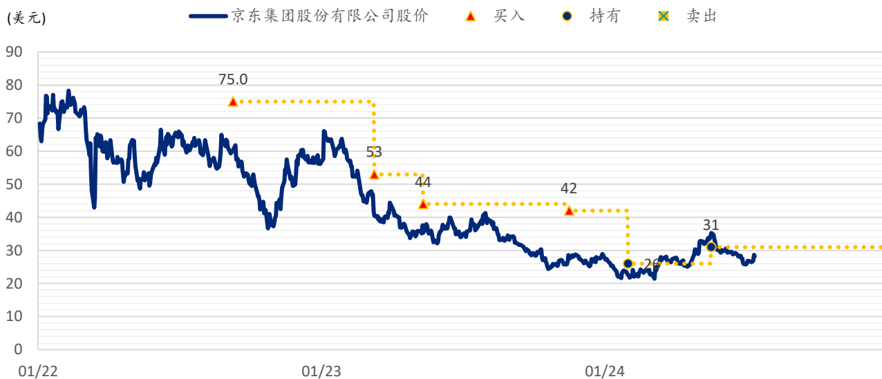
图表 3：浦银国际目标价：京东（JD.US）

注：截至 2024 年 7 月 12 日收盘