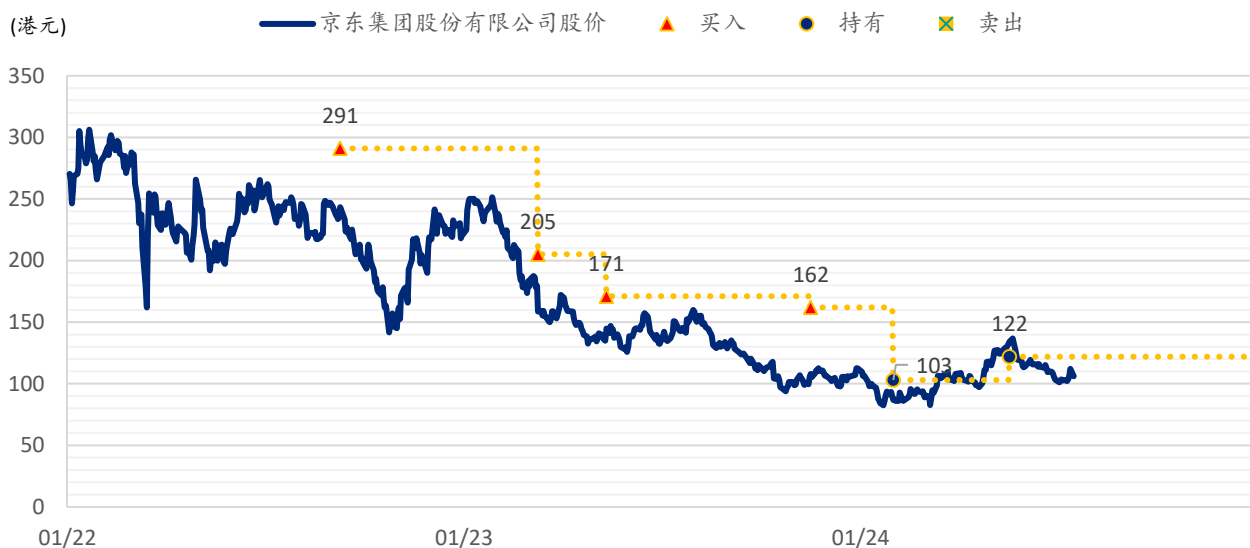
图表 2：浦银国际目标价：京东（9618.HK）

注：截至 2024 年 7 月 12 日收盘