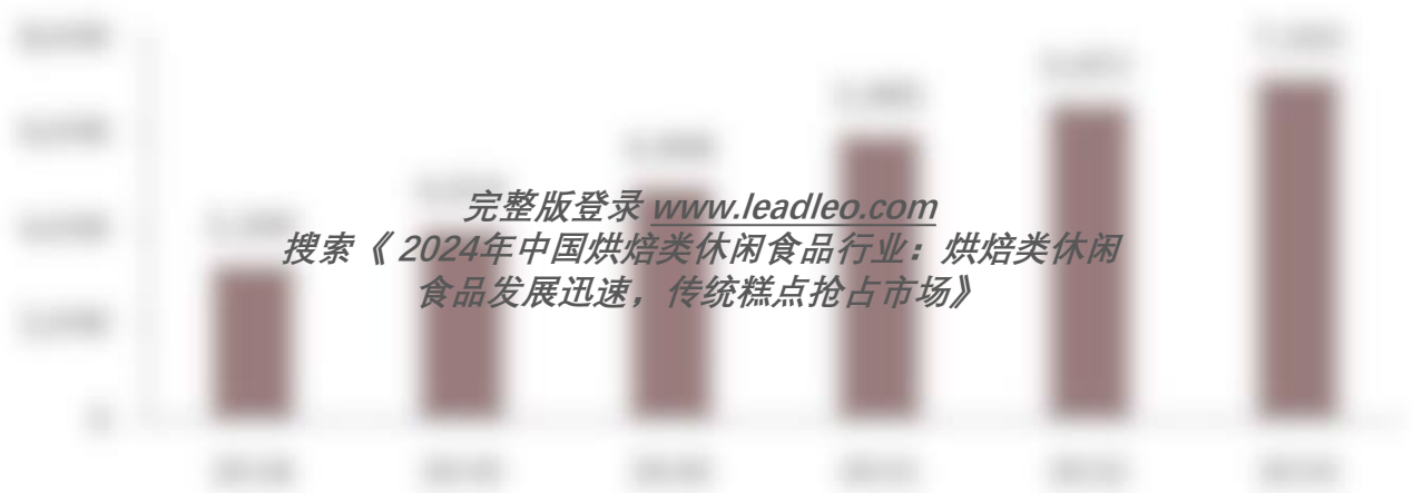
中国冷链物流市场需求量，2018~2023年