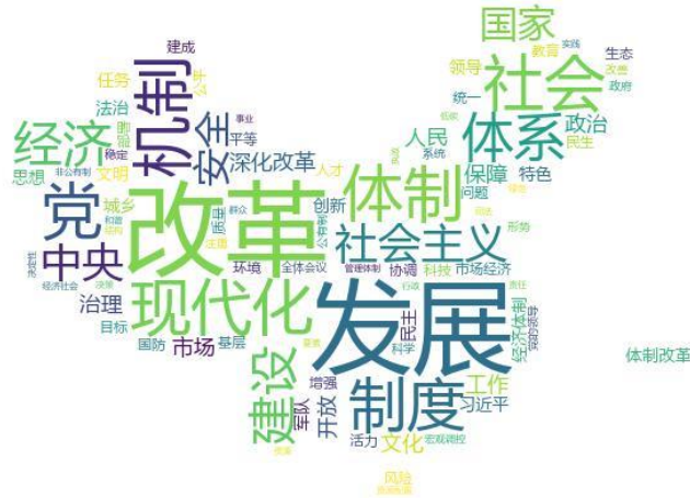
图表1 二十届三中全会词云图

2024年7月18日，新华社授权发布党的二十届三中全会公报。从这份简报中可以一窥本次三中全会的主要精神。