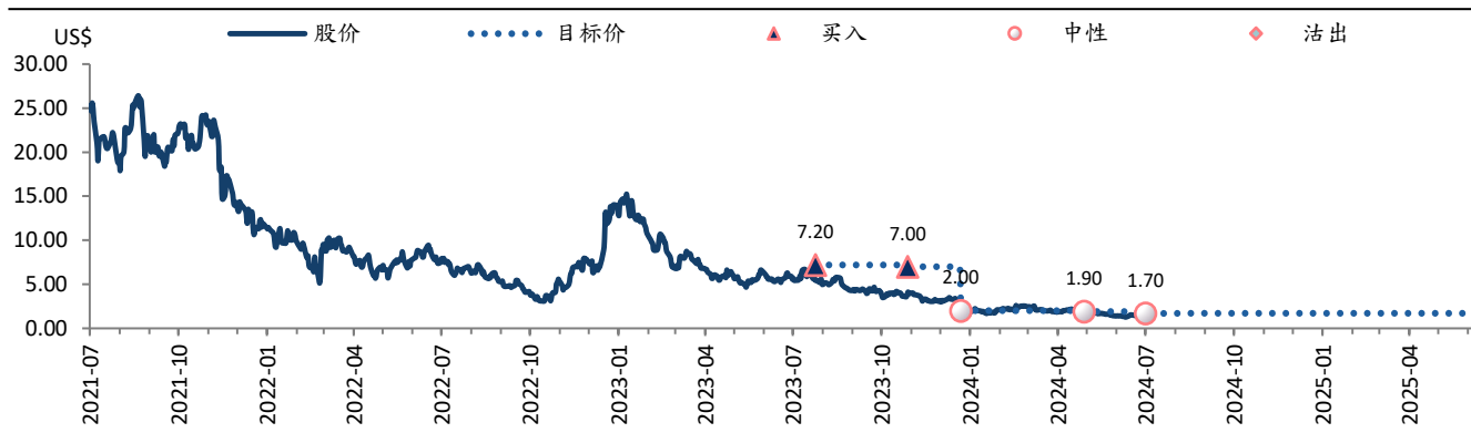
图表 2: 达达 (DADA US) 目标价及评级