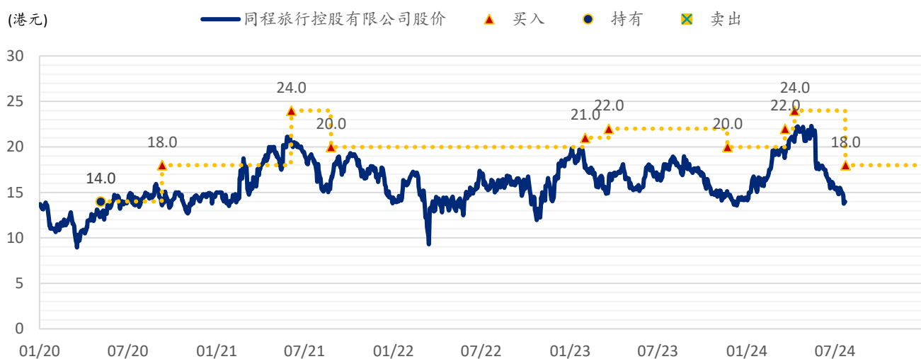
图表 2: SPDBI 目标价: 同程旅行 (780.HK)