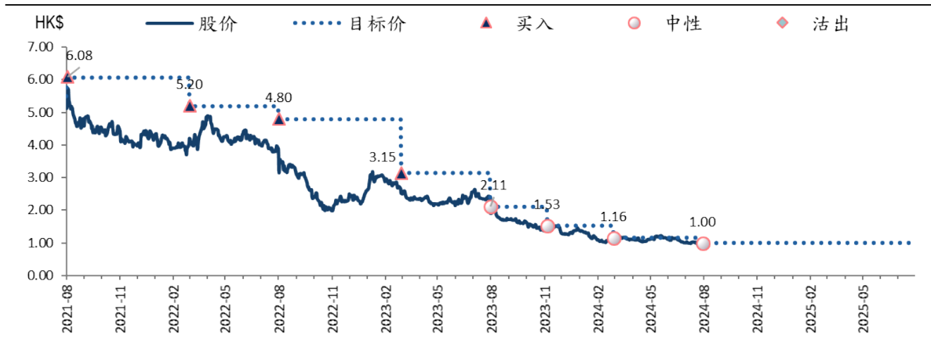
图表 3: 信义能源 (3868 HK) 目标价和评级