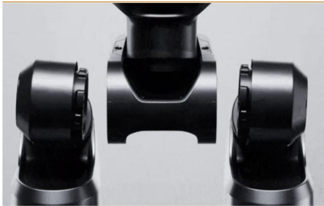
图 6：Figure 02 预告

Figure 创始人宣布 8 月 6 号推出 Figure 02。8 月 3 日，Figure 创始人布雷特·阿德科克在推特宣布预计 8 月 6 号发布 Figure 02，推出最新预告片，并且表示“Figure 02 是地球上最先进的人形机器人”，预告片展示了 Figure 02 的一体化关节、新的仿人足部与灵巧手，灵活度提升明显。