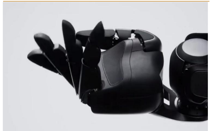
图 7：Figure 02 预告