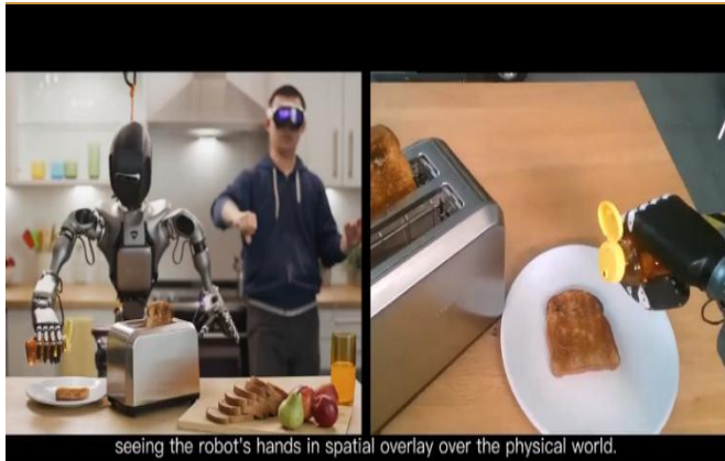
图 4：人类通过 Apple Vision Pro 控制人形机器人