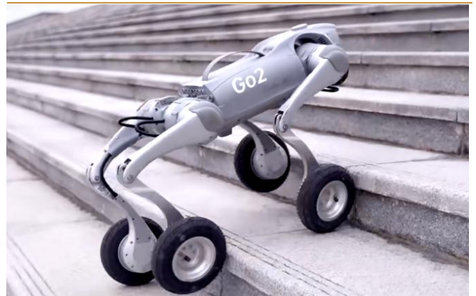
图 3：宇树发布四足轮式机器人 Go2 视频