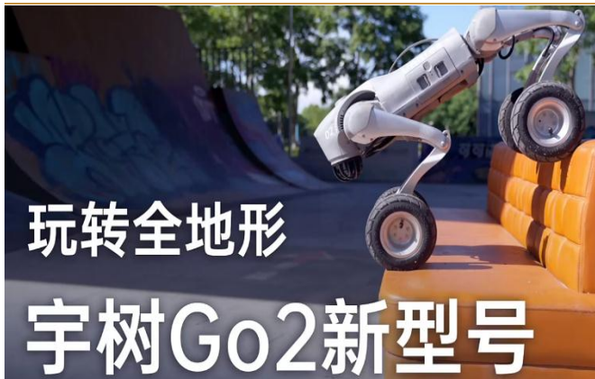
图 2：宇树发布四足轮式机器人 Go2 视频

宇树发布四足轮式机器人 Go2 视频。 7 月 30 日，宇树科技发布四足轮式机器人 Go2 视频，Go2 能够实现：灵活在台阶、坡面上行走；跨越较高的障碍物；实现仅前两足支撑地面。