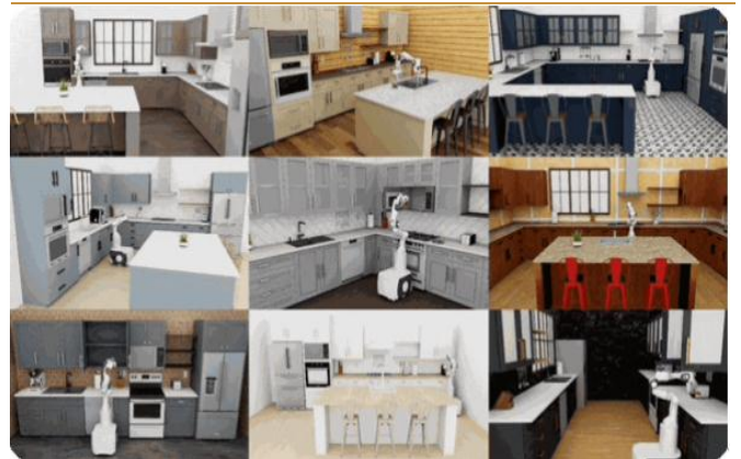
图 5：使用生成式模拟框架 RoboCasa 增加演示数据