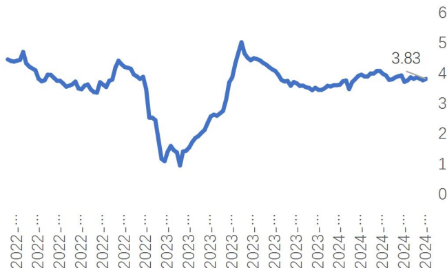
图3：封闭6-12个月固收产品近6月年化收益率均值（%）