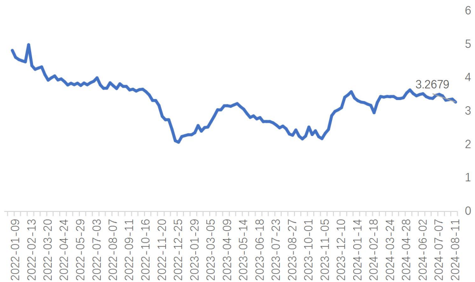
图 4：封闭 1-3 年期固收理财近 1 年年化收益率均值 (%)