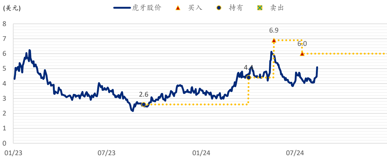
图表 2：浦银国际目标价：虎牙 (HUYA.US)

注：截至 2024 年 8 月 13 日收盘价